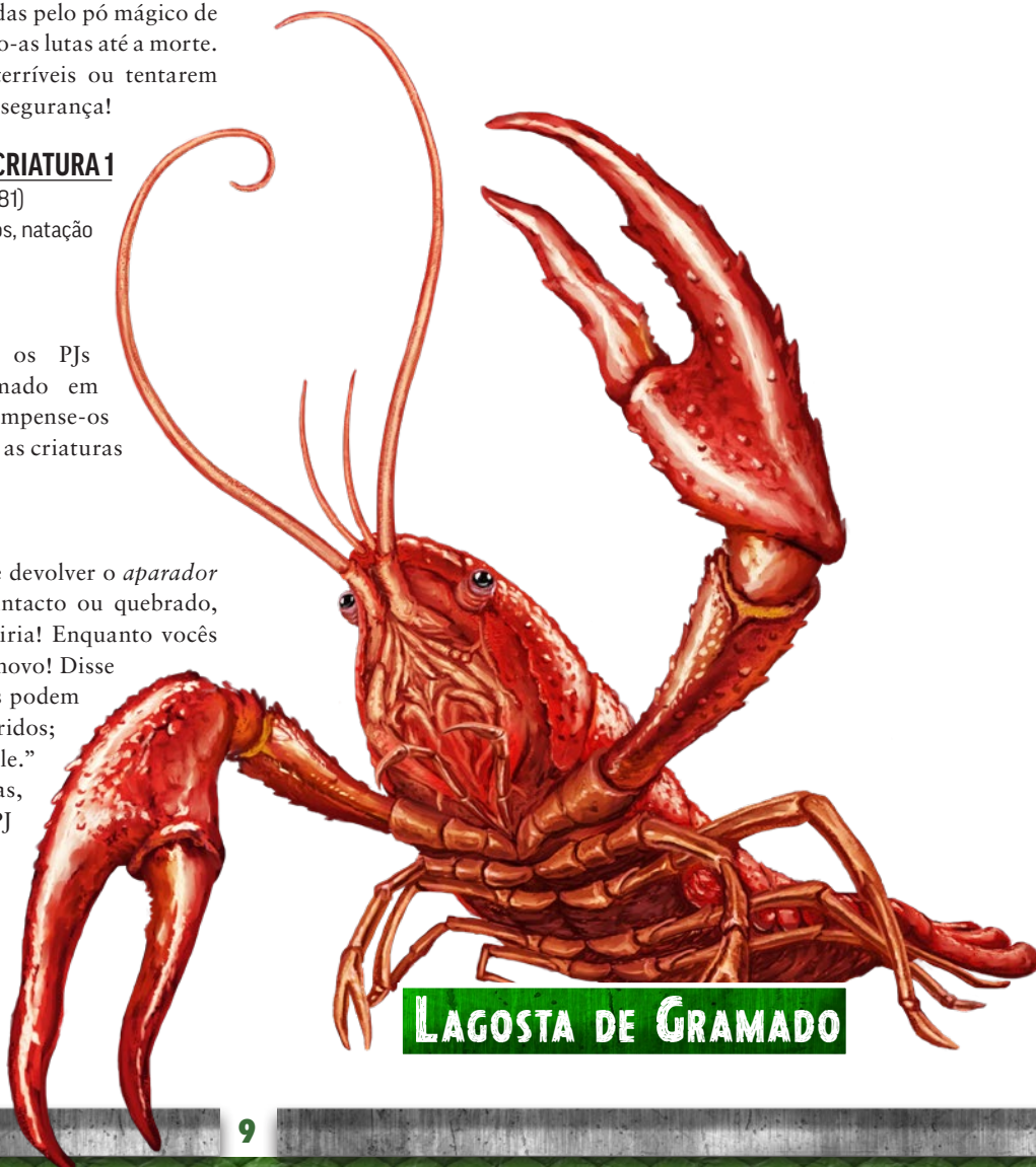
LAGOSTA DE GRAMADO

jardim; mesmo se os PJs voltarem de mãos vazias, os outros kobolds ainda ficam entretidos pelas histórias dos PJs, embora eles provoquem os PJs pelo sucesso parcial. Se os PJs conseguirem matar todas as lagostas de gramado, os Garra-de-Gancho são rápidos em enviar batedores para recuperar os corpos dos animais — os kobolds então enviam um grupo e assam a lagosta de gramado para banquetearem, brindando aos PJs em agradecimento por fornecerem refeições incríveis. Qualquer que seja o caso, quaisquer kobolds que voltarem vivos receberão promoções e podem vislumbrar um futuro melhor e um lugar mais importante entre os Garra-de-Gancho!