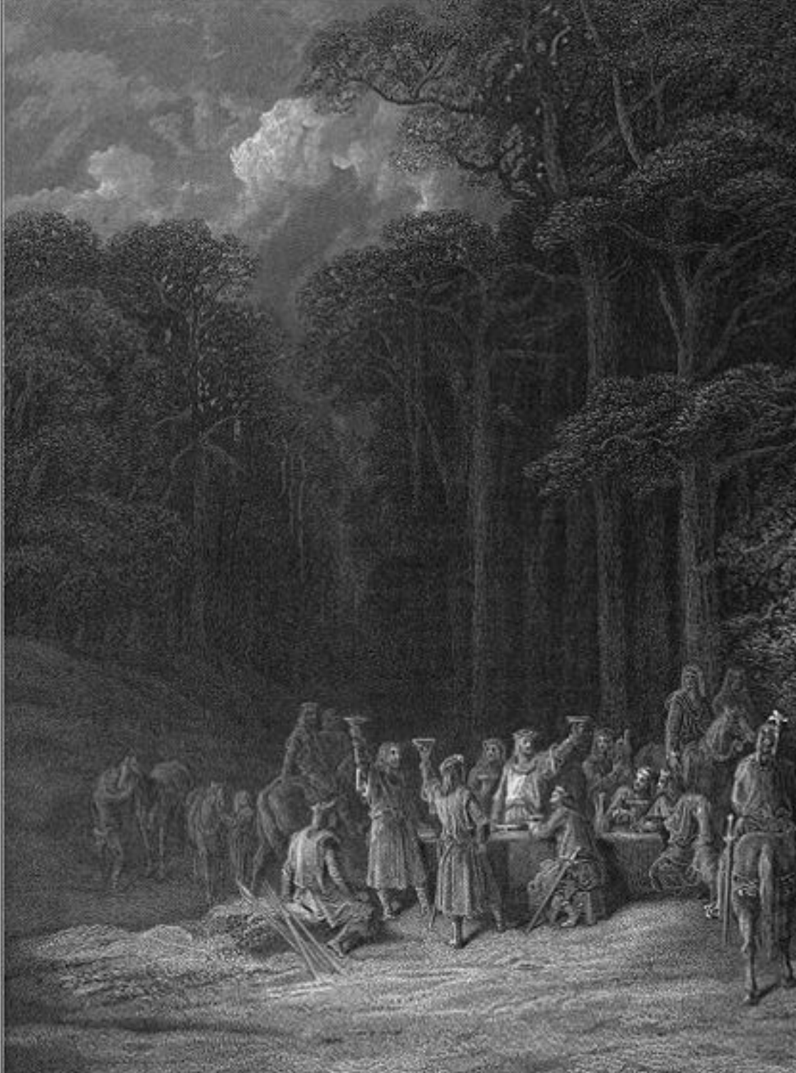
Homens, elfos e anões comemoram a fundação do Reino sob as Três Coroas"