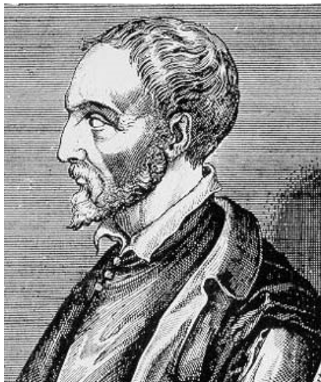
O Rei Petro Lobos

“O Castelo da Matilha” : sobre uma colina alta, próximo ao porto,