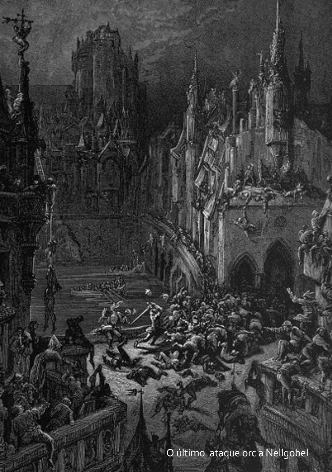
O último ataque orc a Nelligel