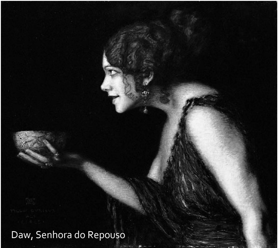
Daw, Senhora do Repouso

guerreiro alado cabeça de águia, trazendo uma cimitarra em cada mão. Rhîw é conhecido por sua inconstância: embora seja responsável pelos ventos que trazem a chuva, também é ele quem congela o mundo durante o inverno.