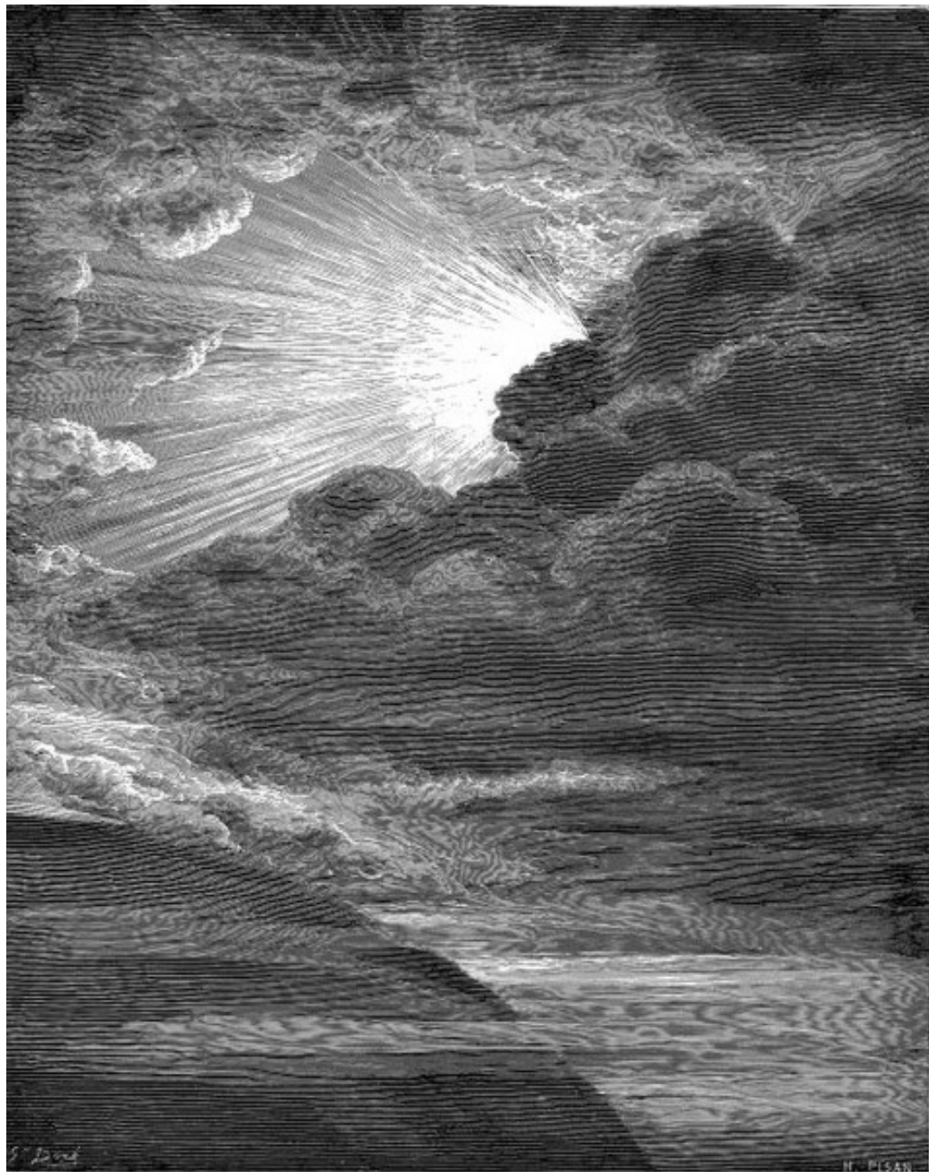
Surgimento de Anor, o Sol