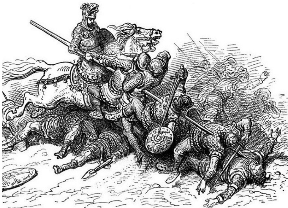
Pintura retratando Rendevor empalando os três orcs.

Além do gelo eterno do topo da montanha, a magia divina de Rhîw pode ser sentida protegendo o local. O templo é local de peregrinação dos fiéis e todo o clérigo devoto de Rhîw sente-se obrigado a visitá-lo ao menos uma vez na vida. O administrador do templo é Encaitaro, Supremo Mestre do