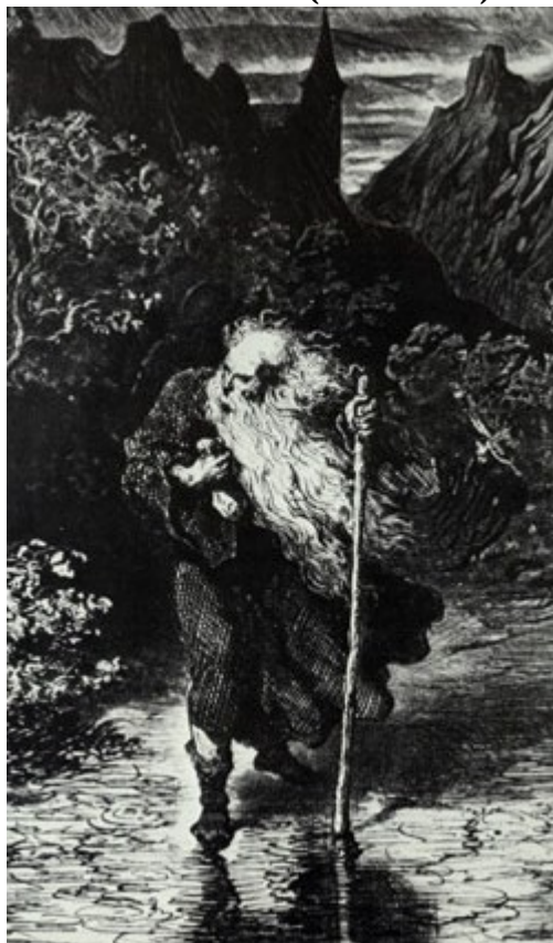
Willard Investiga os arredores da torre