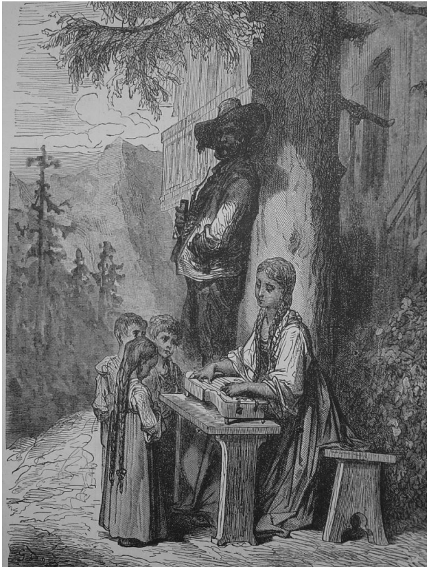
Uma típica família de Bruntoll

Se você quer um mundo apenas para encher de masmorras e magos insanos, calcular danos e