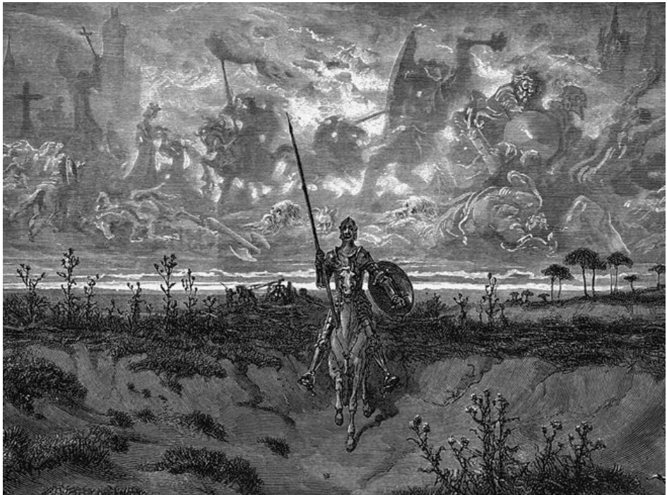
Eored cavalga e recorda os feitos de sua vida

O brasão da ordem é composto por duas partes principais: o elmo e o escudo. O elmo, ornado com chifres e envolto em um manto azul, representa a valentia e honra dos dragões metálicos. O escudo vermelho, rodeado por um dragão