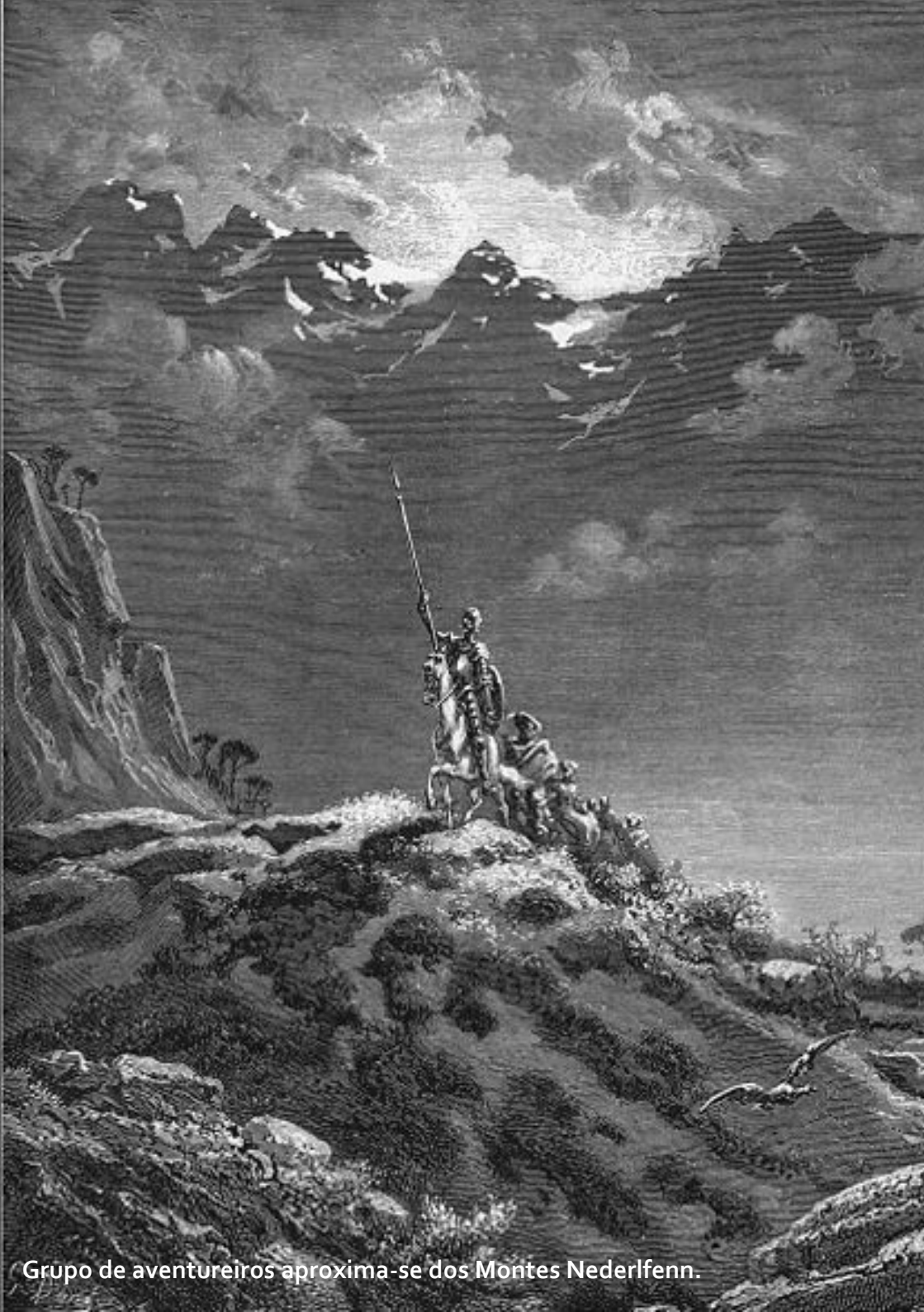
Grupo de aventureiros aproxima-se dos Montes Nederlfenn.