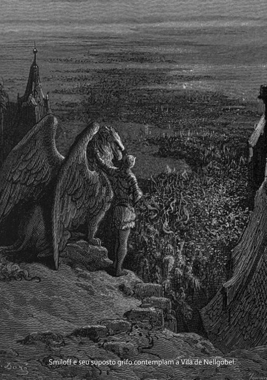
Smiloff e seu suposto grifo contemplam a Vila de Nellgobel.