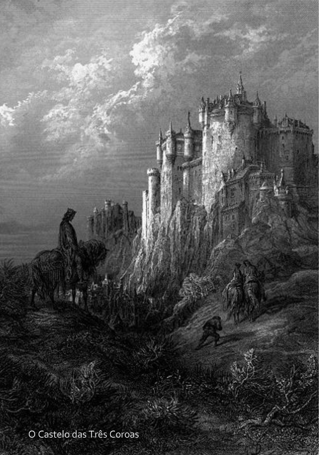
O Castelo das Três Coroas