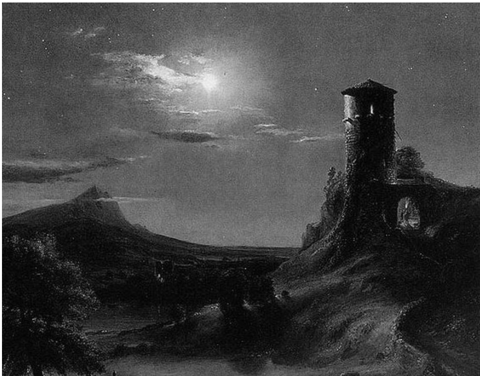
A Torre de Willard

Rub nasceu e cresceu em Gardhorod, portanto, possui sangue bárbaro em suas veias. Suas roupas surradas, sempre sujas de fuligem, seu comportamento sem etiqueta e seus cabelos sempre desgrenhados