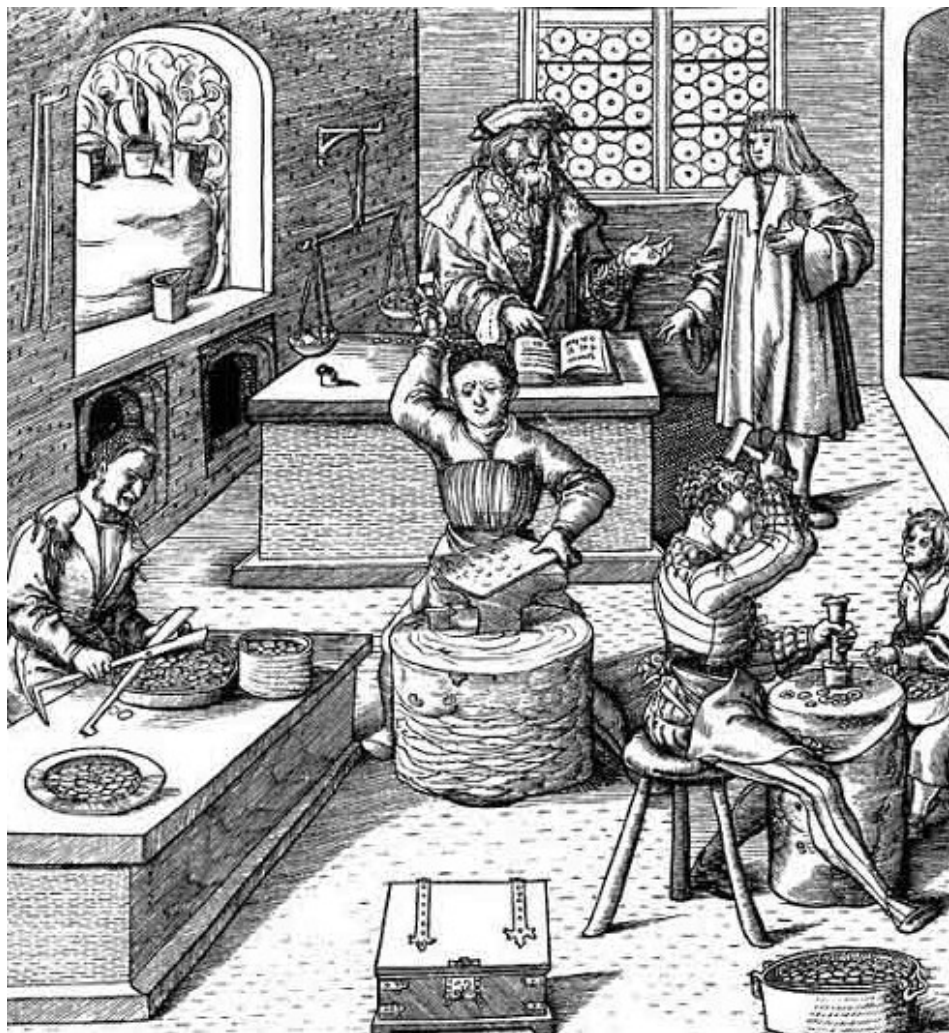
A cunhagem das moedas em Bruntoll

As línguas dos reinos normalmente dividem-se em três principais, subdivididas em dialetos. São elas a língua comum, falada por todos, a élfica e a anã. Os dragões possuem sua língua própria, assim como os orcs. Várias raças possuem suas