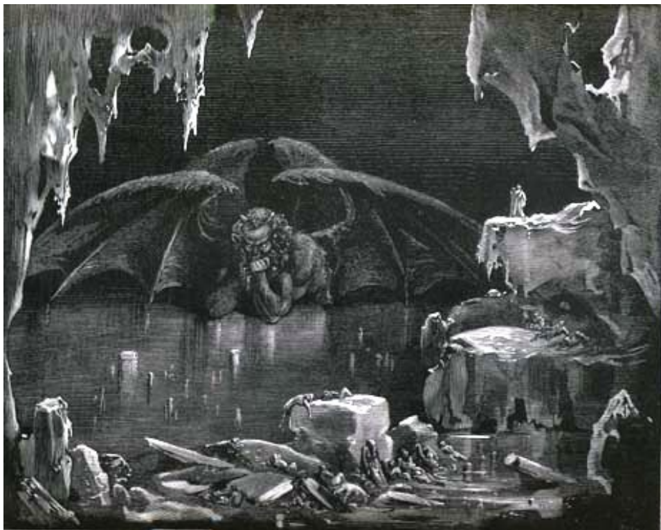
Haleth e Zamoreth observam a prisão de Urizen.

“ Encaitaro, Supremo Mestre do Frio (N h m C20) ”: O Mestre do Frio é dono de uma paciência incrível, fala lenta, arrastada e sussurrada. Ninguém sabe ao certo o que garante a longevidade deste senhor, mas todos sabem que ele comanda o templo há, pelo menos, cento e trinta anos. Sua política é a neutralidade; Encaitaro procura evitar envolver-se com problemas que não estejam relacionados ao seu deus ou ao destino de Aymer