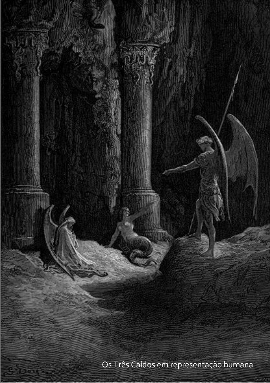
Os Três Caídos em representação humana