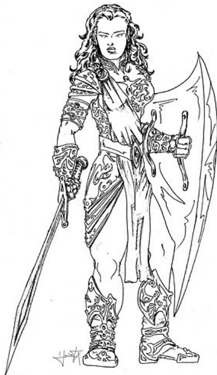
"Homem" de armas?

Soldados trendorianos guardando fronteiras, cavaleiros rochtalfenses perseguindo orcs, mercenários menadenses vendendo sua proteção às caravanas, gladiadores lutando pela glória em Parchsad... há muito espaço para os Homens de Armas em Aymer. Embora seja a classe mais abundante, sempre há