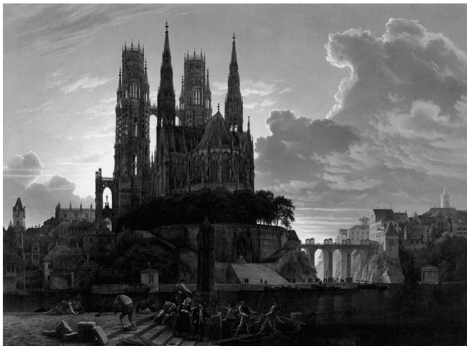
O Castelo da Matilha