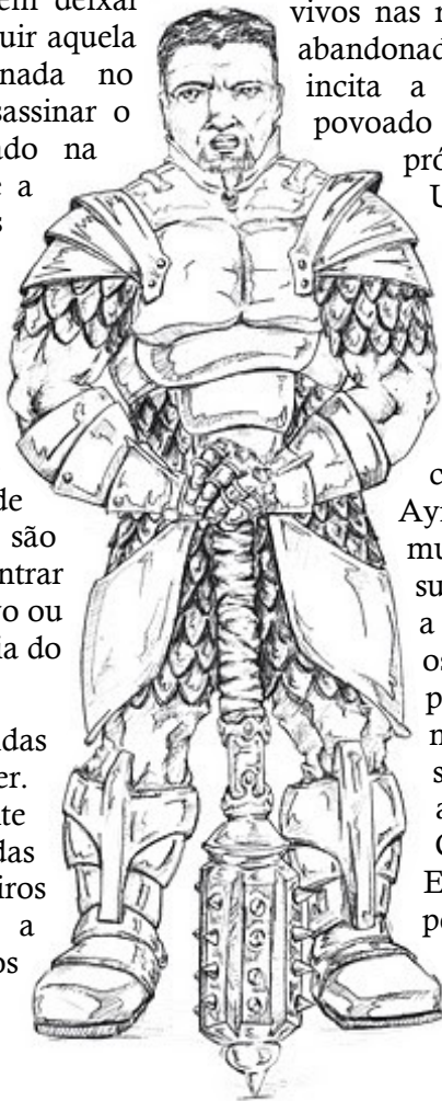
Clérigos: fé em Todo e devoção a seus filhos

A principal diferença entre um clérigo devoto de Aymer para os de outros mundos é a escolha de sua divindade patrona: a menos que ele cultue os Três Caídos, sendo, portanto, um cultista mal-visto pela sociedade, o clérigo adorará a Todo, o Criador de Tudo. Evidentemente, ele poderá escolher um dos Eternos, os Filhos de Todo, para ser devoto. É importante frisar que não existem