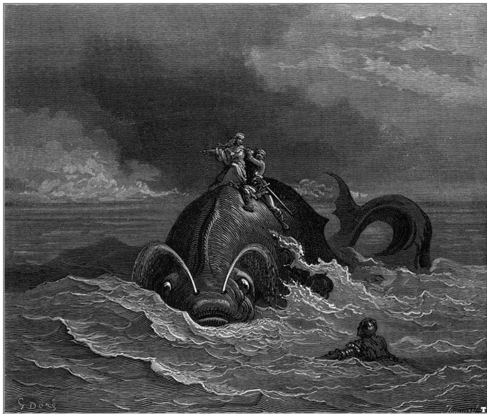
Uma criatura marinha auxilia os elfos no Principado

Esse é o segundo reino élfico do mundo. Embora não deva subserviência a Erynedhel, o Principado Élfico mantém uma relação fortíssima com seu reino de origem. O Príncipe Inramil sempre viaja para o Sul, seja para pedir conselhos ao Patriarca elfo ou para rever o belíssimo reino das florestas.