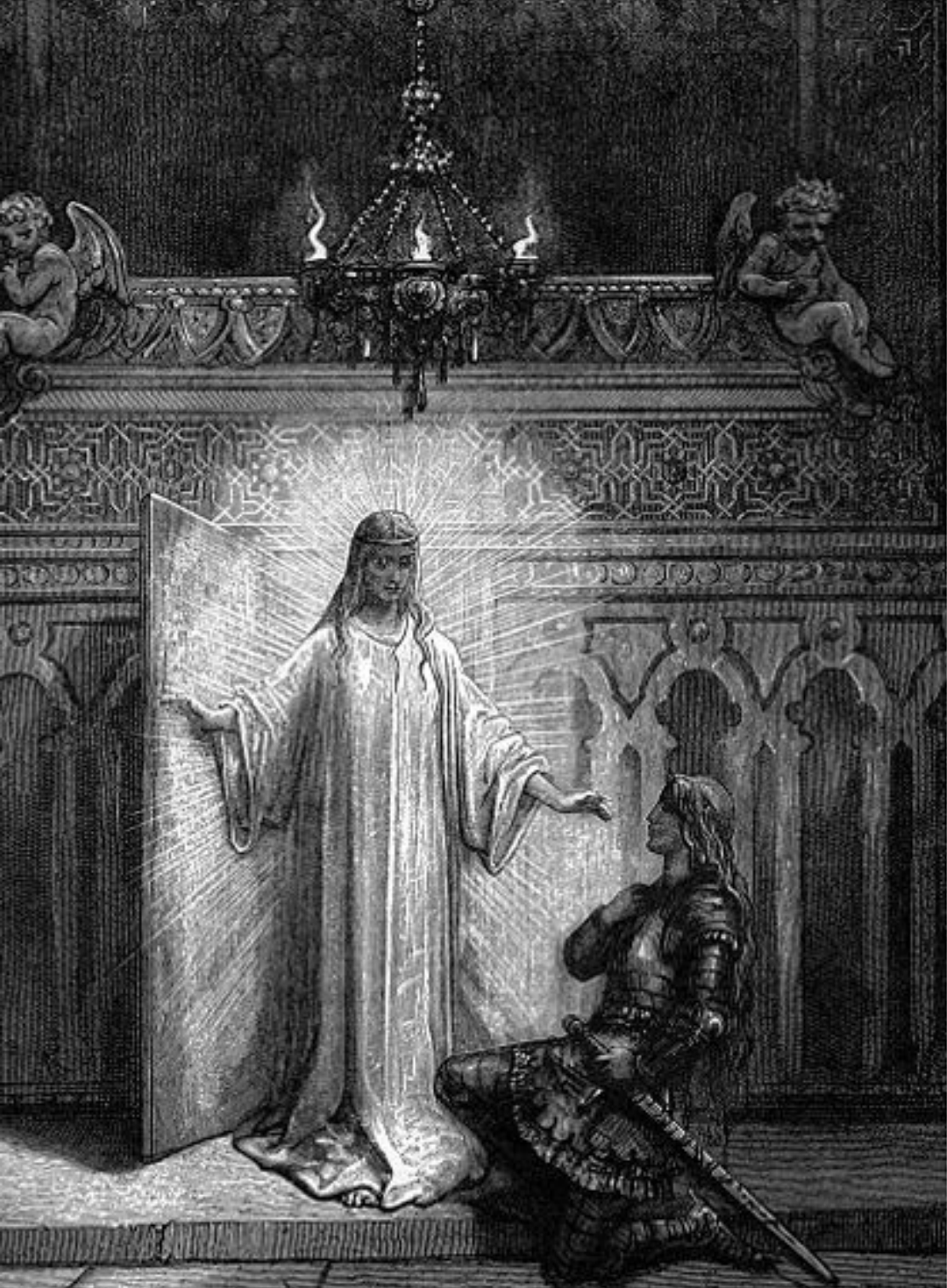
Uma paladina de Ithil tem uma visão de sua deusa