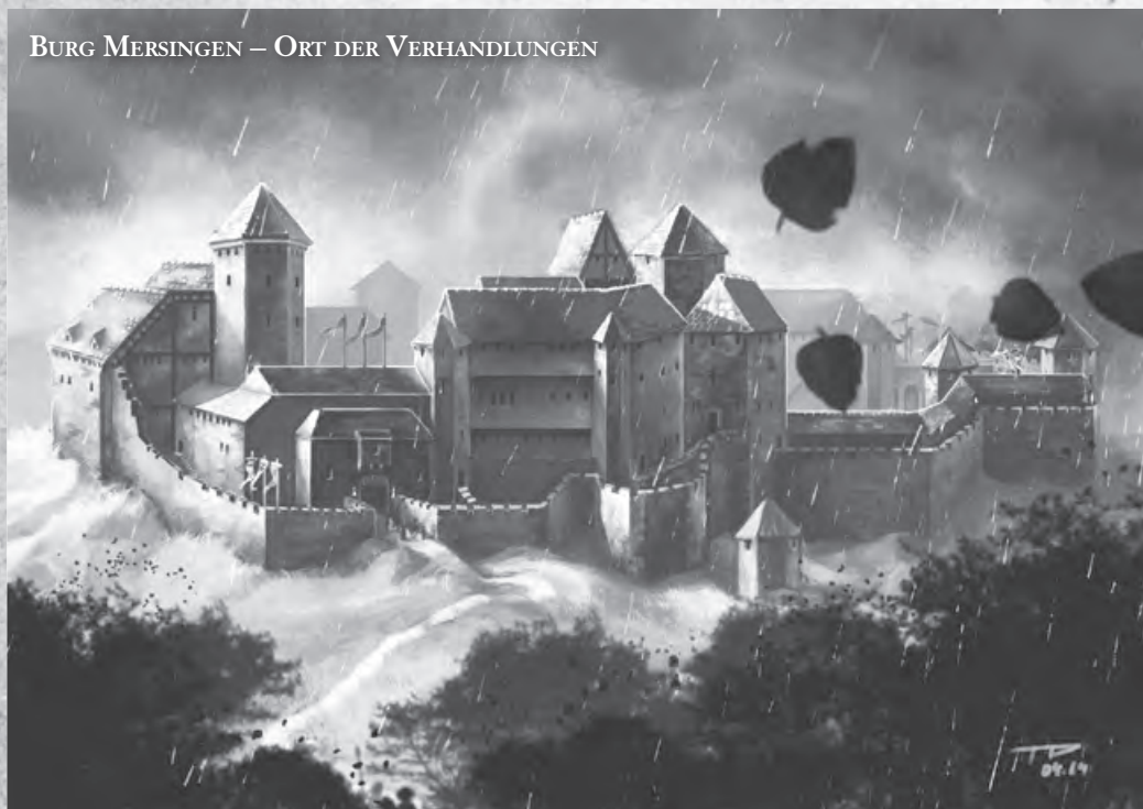
BURG MERSINGEN – ORT DER VERHANDLUNGEN

Eminenz Gwidühenna von Faldahon, „wo Jel-Horas den ersten großen Sieg im Osten errang. Von diesem geschichtsträchtigen Ort aus brach er den Widerstand der Alhani und Barbaren im Osten. Seine Taten werden uns Mut schenken und Ansporn für Kommendes sein. Inmitten unserer Lande gelegen und vom Feind besetzt, soll es für unseren Pakt stehen und uns daran erinnern, dass wir Höherem verpflichtet sind.“ Kaum dass die Botschaft den Adel der Marken und übrigen Provinzen des Raulschen Reiches erreichte, begannen unzählige Spekulationen über die Folgen des Paktes. Spärlich ist noch immer das, was über die Beratungen