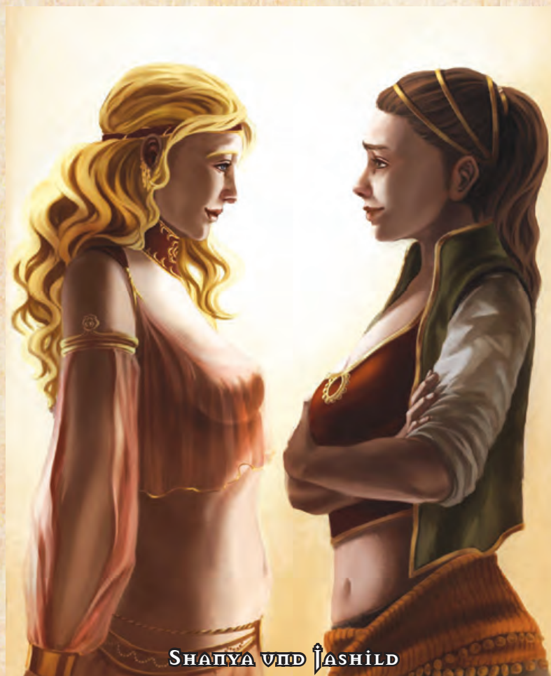
SHANYA VMD JASHILD

◆ Die Rahjakirche: Mit Shanya ash Shaya (*1111 BF, ausgesprochen sinnlich und hübsch, blondgefärbte Haare) ist in Elburum eine Gegenspielerin für die Schleierverschwörung erwachsen, die zwar noch nichts vom Ausmaß ahnt, dafür aber entschlossen handelt. Jashilds verschwenderischen Lebensstil prangert sie an, da sie nur an die Befriedigung ihrer eigenen Gelüste denkt. Jashild würde sie am liebsten aus der Stadt werfen, Shanyas Beliebtheit im Volk übersteigt aber die der Sultana bei Weitem – und macht sie deswegen zu einer gefährlichen Gegnerin.