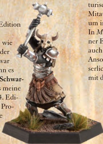
Zholochai Häuptling (Schicksalspfade)

Darüber hinaus wirft der inneraventurische Bote Blicke auf die Entwicklungen am Rand der Schattenlande, vor allem auf die