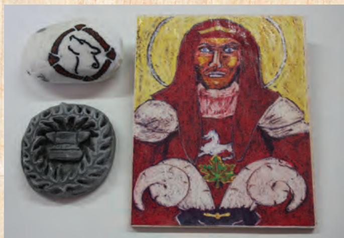
Am Ende des MPA erhalten die Spieler von Zeit zu Zeit kleine Geschenke, die im MPA den Helden als Dank überreicht wurden. Hier sind abgebildet: ein Stein mit dem Signet des Odüns Wolf (2004), eine Steinmünze mit Feuerrand und dem Angram-Symbol Amboss (2005) und eine Ikone des Bogumil von Arivor (2013).

2014 markiert dabei nicht nur das Jubiläum für 30 Jahre Das Schwarze Auge . Es gibt noch ein zweites Jubiläum zu feiern: Seit