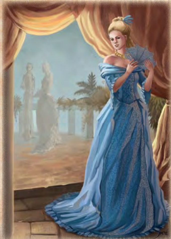
Carvaia ya Dergamon

Agenda: Verbesserung der Handelsbeziehungen zwischen dem Horasreich (insbesondere Kuslik) und Al'Anfa (insbesondere dem Haus Karinor). Später auch: Mehrung der eigenen Macht und Einfluss, Befriedigung von Nervenkitzel und verbotenen Gelüsten.