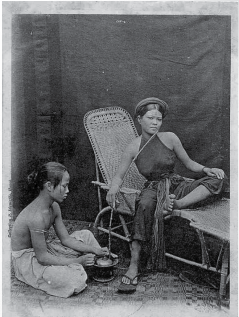
Fumeuse de pipe en Asie

Les investigateurs vont avoir l'occasion d'entrer dans le Rêve d'Opium afin d'y rechercher des informations ou pour libérer un prisonnier du sommeil. Ce voyage prend la forme d'un rêve étrange qu'il faut quitter sans tarder et peut représenter une expérience unique, même pour les investigateurs aguerris.