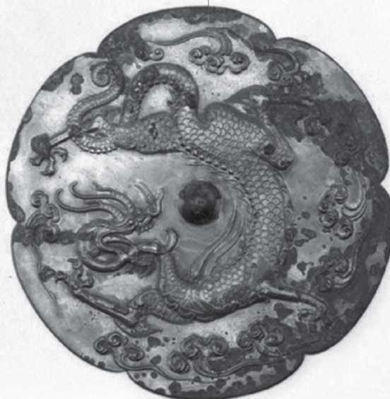
Le dragon, créature emblématique de la mythologie chinoise