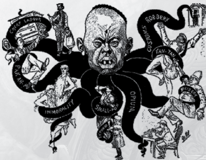
Vision tentaculaire du danger asiatique