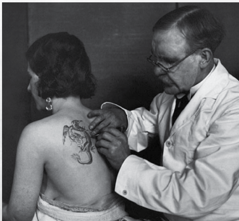
Tatouage d'un dragon

Les tatoueurs utilisent des encres rarissimes dans la réalisation de ces tatouages. La recherche d'encres spéciales est une quête permanente : antiques écritures chinoises, source inaccessible et même utilisation de sang humain ! Très souvent, il faut