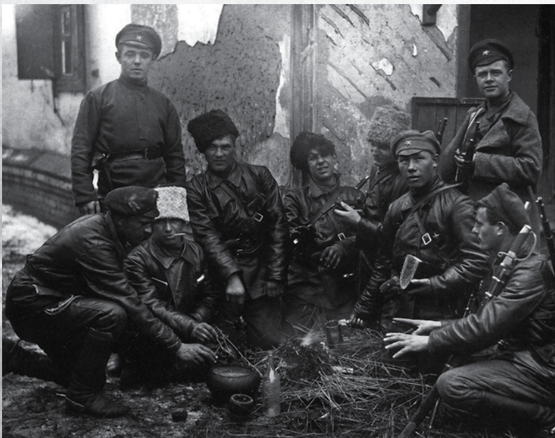
Bivouac à la frontière russo-mandchoue