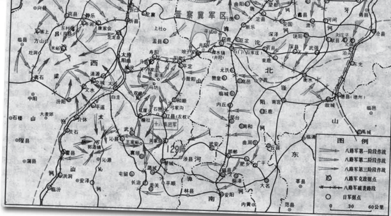
Carte des opérations militaires durant la révolution chinoise

Dans tous les cas, le Mandchou fait patienter les Russes en leur laissant croire qu'ils peuvent lui soutirer d'autres avantages. Pour prouver sa bonne foi, il capture les anti-bolcheviques qui passent sa frontière pour échapper à Staline et les livre aux camps de prisonniers des dirigeants soviétiques.