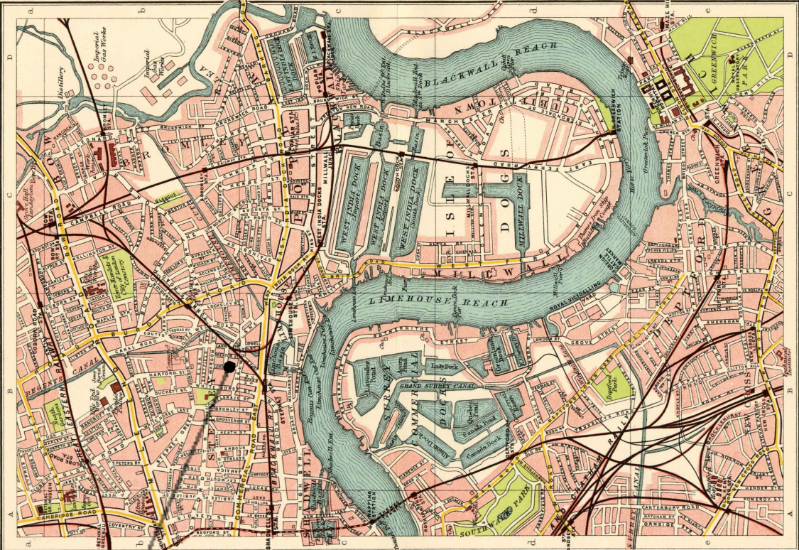
Casa de Chu Ming